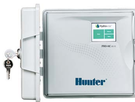
Pro-HC (plastikowy, zewnętrzny) Wysokość: 22,8 cm Szerokość: 25 cm Głębokość: 10 cm