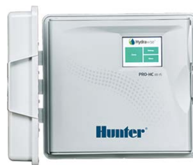
Pro-HC (plastikowy, wewnętrzny) Wysokość: 21 cm Szerokość: 24 cm Głębokość: 8,8 cm

Wypróbuj oprogramowanie Hydrawise już dziś, bez sprzętu na stronie hydrawise.com